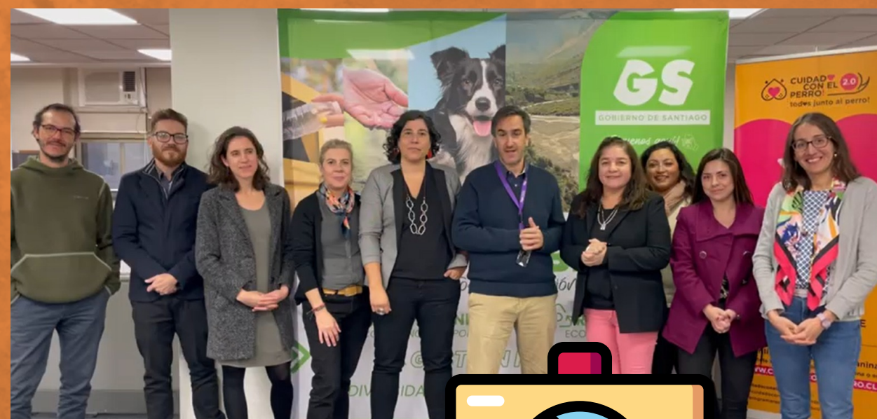
Equipo Medio Ambiente

En esta versión del Goretín, les contamos acerca de algunos proyectos que trabajamos con mucho cariño y orgullo desde el Departamento de Medio Ambiente, Biodiversidad y Acción Climática, para que esta temática sea un aspecto clave en nuestro querido Gobierno Regional Metropolitano de Santiago.