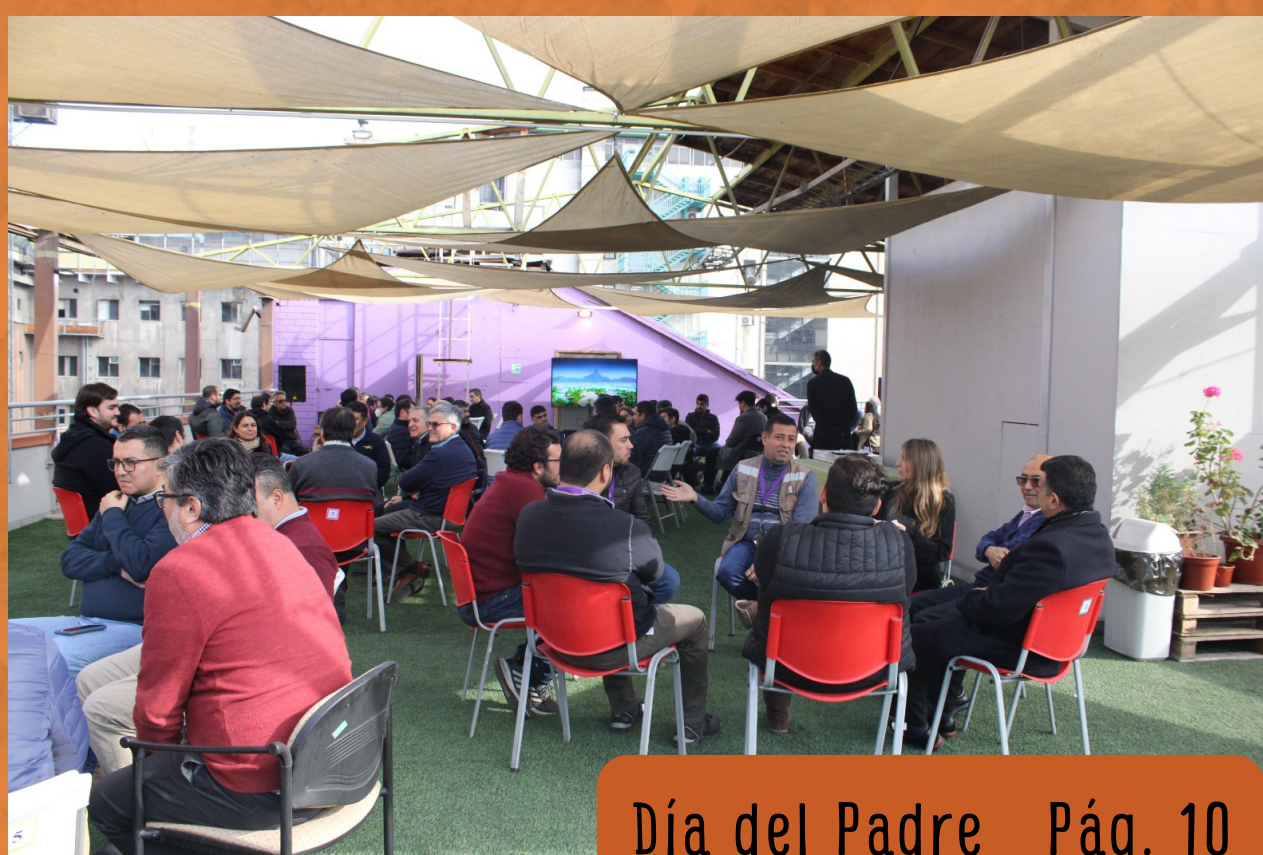
Día del Padre Pág. 10