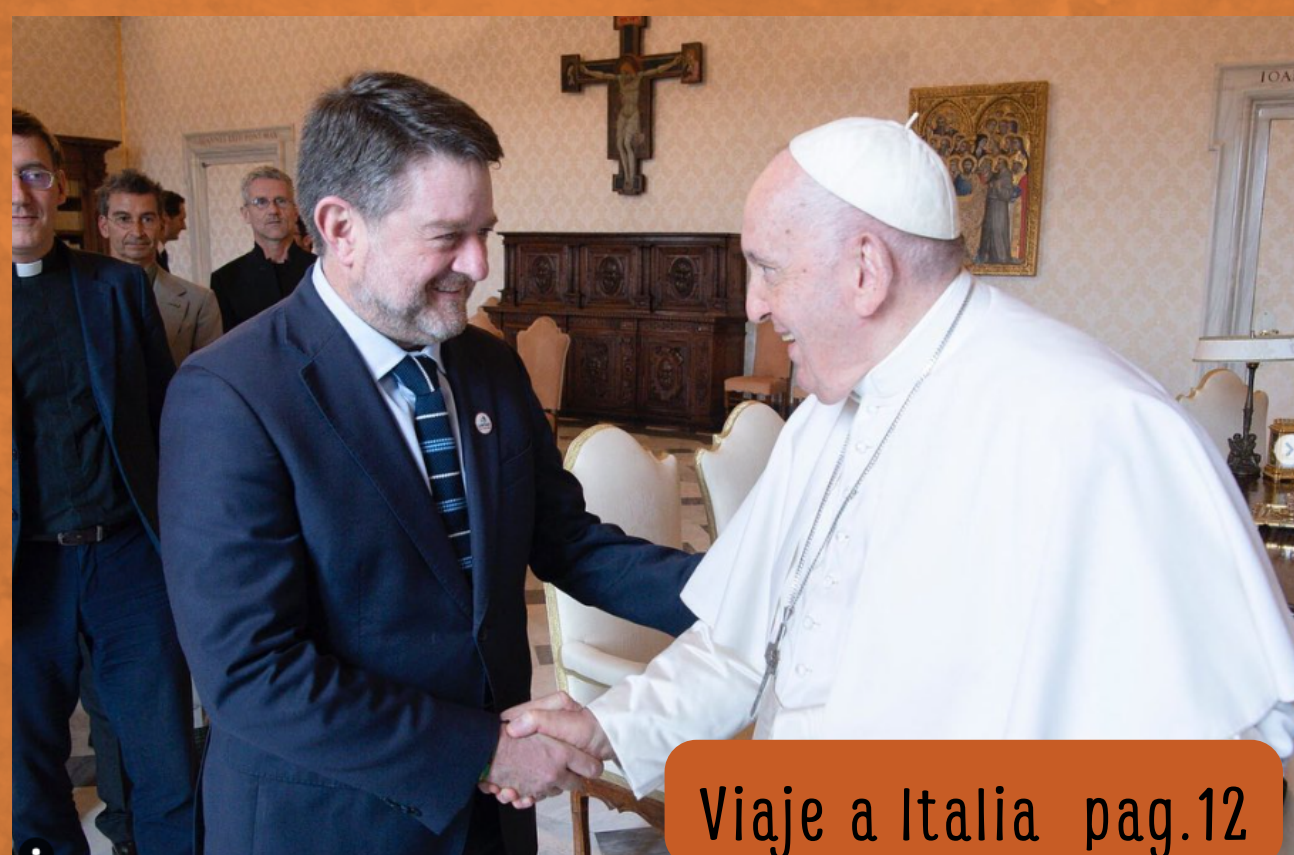
Viaje a Italia pag.12