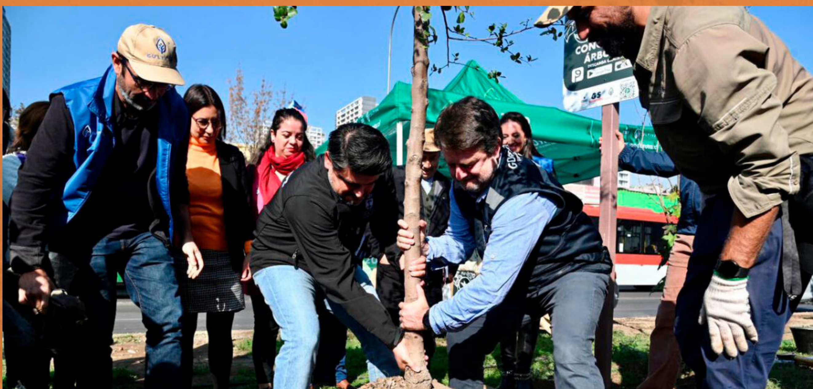
Gore por el medio ambiente