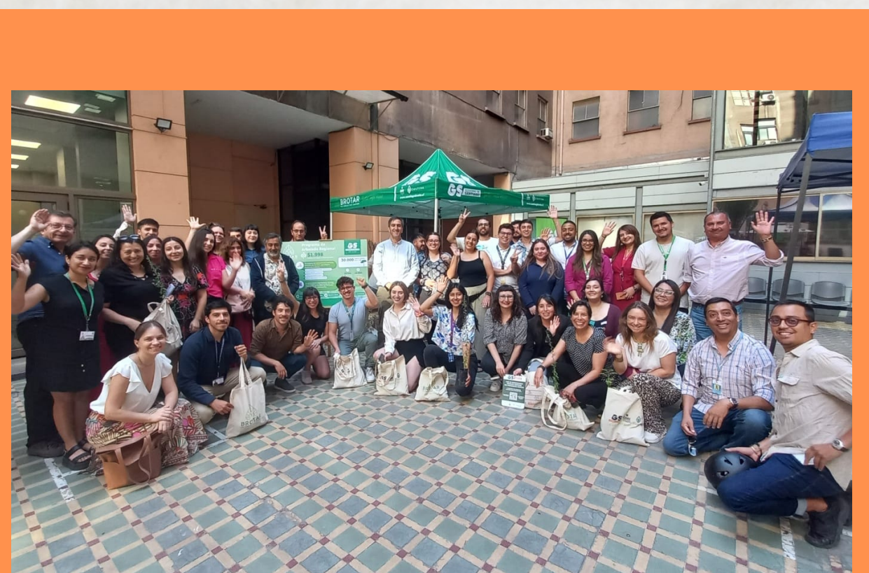
Programa Brotar 6