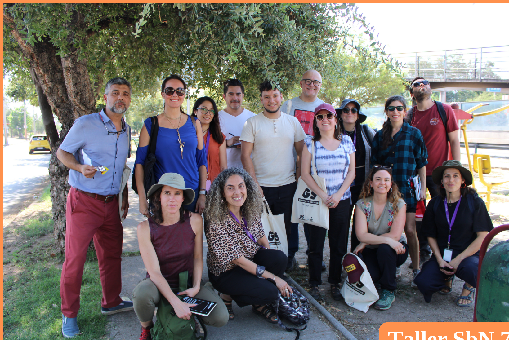
Taller SbN 7