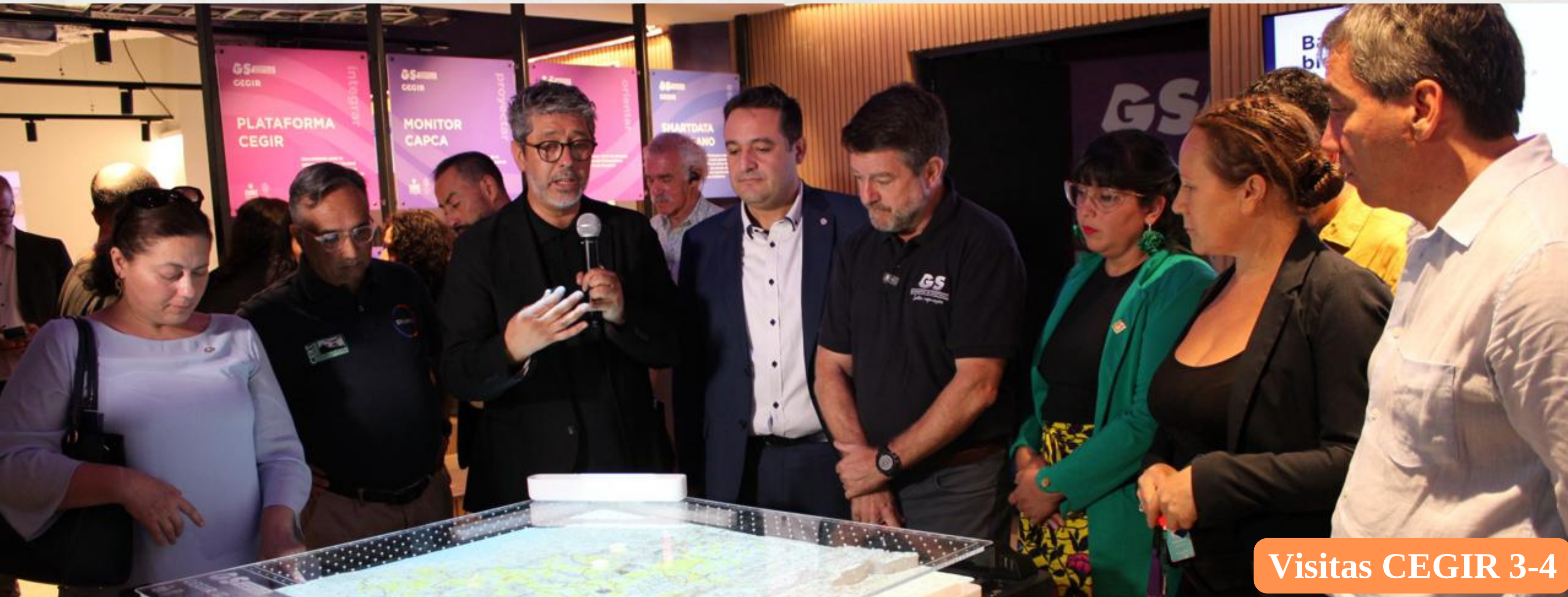
Visitas CEGIR 3-4